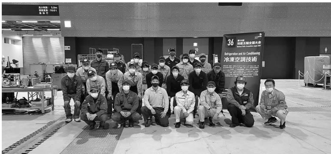
恒例となっている全参加選手と筆者で記念撮影