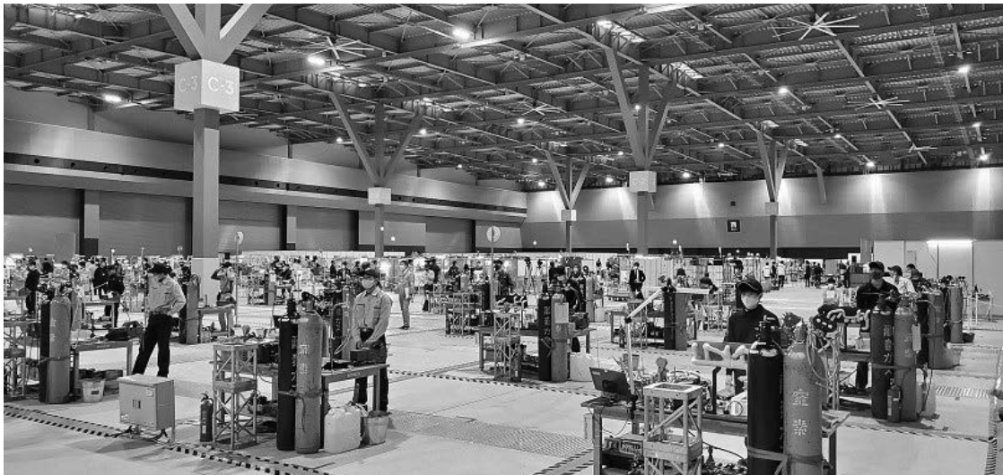
たっぷりのスペースと、観客がほとんどいない競技会場（競技開始前）

競技終了後に、選手たちに聞いてみると、「観客の有無は競技に入ると関係ない。競技に集中して周りは見えなくなる。」とのこと。プレッシャーの強さがうかがえます。