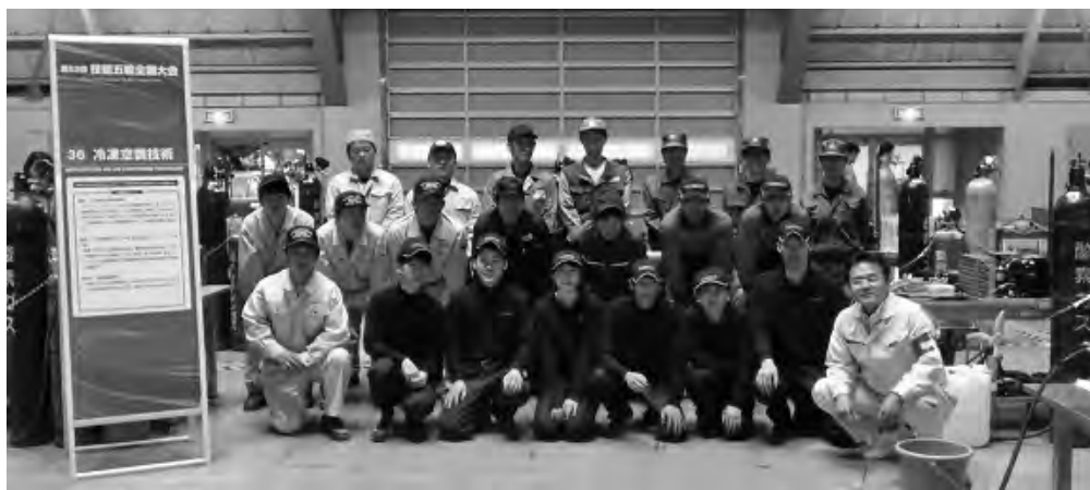
参加選手と記念撮影

12回目となる冷凍空調技術職種、今大会は過去最大の21名という参加人数とこの職種への関心度が高まってきていることが予想でき、会場を埋め尽くしているギャラリーの多さも納得できます。技能五輪全国大会は、満23歳以下の若手技能者が技能レベルの日本一を競う大会で、ものづくり産業の基盤を担う技能者の育成や技能の重要性のアピールを目的として毎年開催されています。次回の第54回大会は、山形県で平成28年10月21日(金)から24日(月)までの開催予定が公表されています。