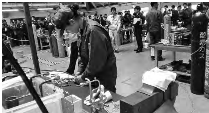
会場を埋め尽くすギャラリーの様子

2004年岩手大会から競技種目となった冷凍空調技術（当時は冷凍技術）職種の当初の課題は1級技能検定を念頭に発展させたもので、配管施工技術要素がかなりのウェイトを占めていました。11回目となる前回大会から、国際大会の課題を意識し、模擬冷凍機作成、制御配線作業から冷却運転、データ測定・処理など、冷凍空調技術の総合的な競技になっています。