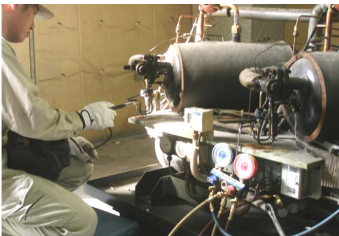
《冷媒フロンの漏えい点検作業》

業務用冷凍空調機器の据付、点検・保守サービスに携わる冷熱技術者の方は、ぜひ今後の資格取得をご検討下さいませようお願い申し上げます。