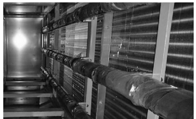
写真 1 空調機内一流体水スプレー加湿器